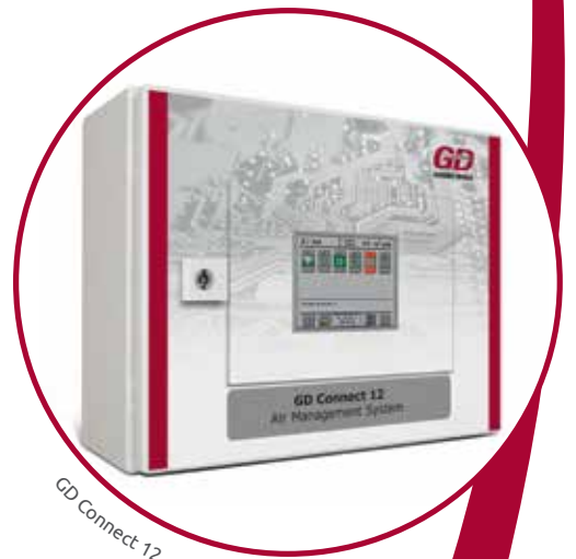
GD Connect 12

Общая емкость этих устройств, как правило, превышает максимальные требования предприятия. Для обеспечения эксплуатации системы на самых высоких уровнях эффективности, используется система управления подачей сжатого воздуха «GD Connect 12».