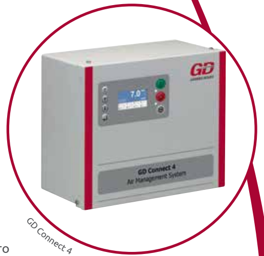
GD Connect 4

Новая система GD Connect 4 – это идеальное решение управления для небольших компрессорных станций, способная контролировать до 4 машин с постоянной скоростью.